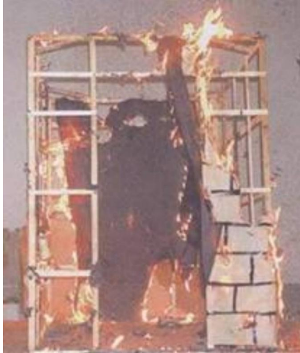
Imagem do castelo do combate dos mouros a arder.