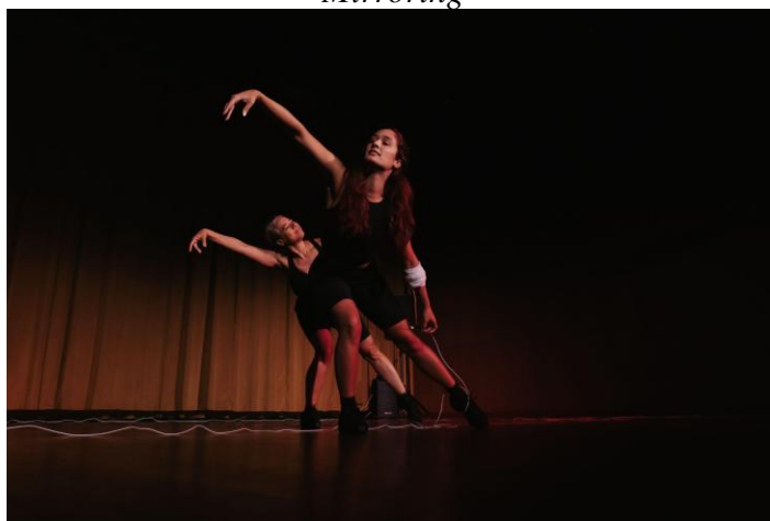
Notes: Photography by Abby Lee, with Antonella Garcia and Giselle Ruzany.

As someone with grown children Garcia's age, I felt responsible for becoming a safe base. For the second prompt, I relied on the attachment theory of psychology, where I offered support and parallel-mirrored her dance movements to connect and make her feel