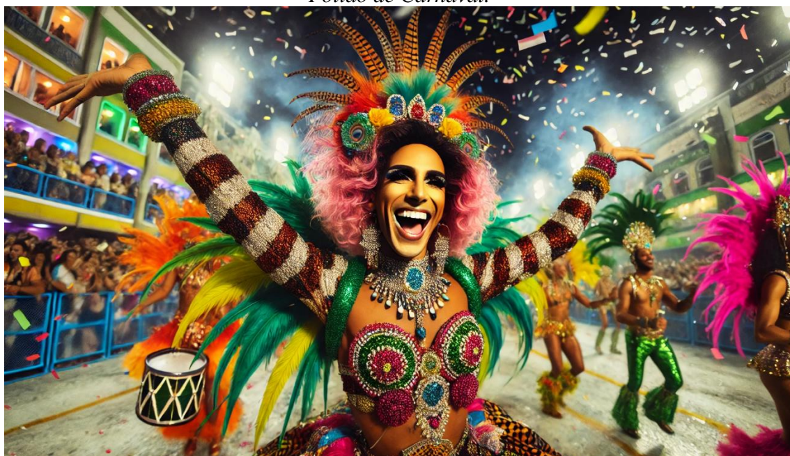
Folião de Carnaval.

Nota: Imagem criada por Inteligência Artificial (ChatGPT 2024).