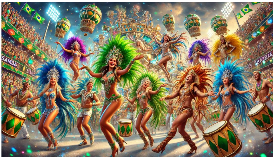
Figura 3 Escola de Samba.

Nota: Imagem criada por Inteligência Artificial (ChatGPT 2024).