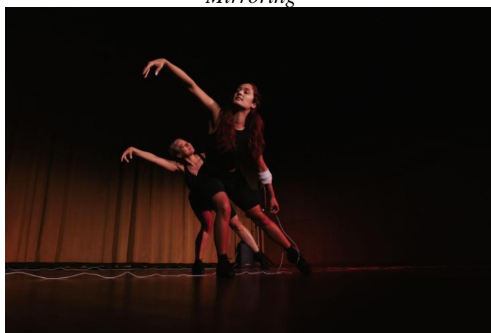
Notes: with Antonella Garcia and Giselle Ruzany.

As someone with grown children Garcia's age, I felt responsible for becoming a safe base. For the second prompt, I relied on the attachment theory of psychology, where I offered support and parallel-mirrored her dance movements to connect and make her feel