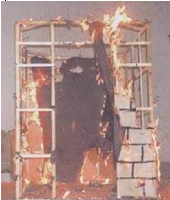
Imagem do castelo do combate dos mouros a arder.